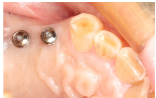
▲ 治療後2週間の口腔内の様子。経過は順調です。

シンプル・安心・リーズナブル なインプラントは、 町田北口歯科までご相談ください。