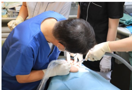
▲ インプラント実践研究会メンバーからの臨床指導の様子