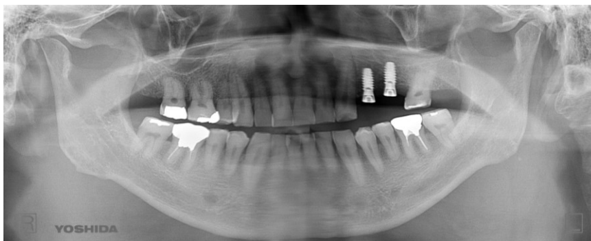
▲ 術後のレントゲン画像。手前：Φ3.7mm L10mm 奥：Φ4.0mm L10mm（ソケットリフト併用）